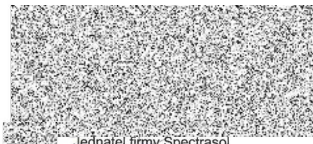
Jednatel firmy Spectrasol