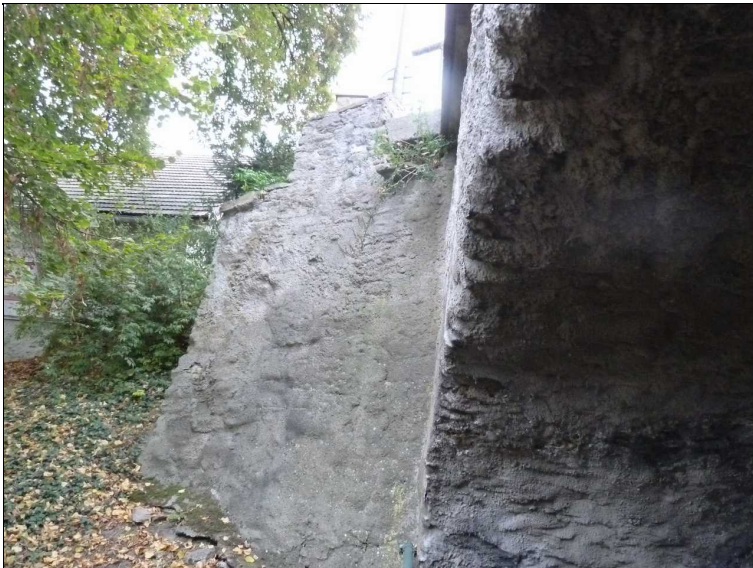
Levé křídlo opěry O2.