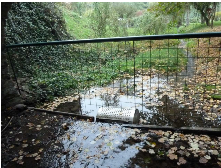
Nevhodně umístěné oplocení vlevo mezi opěrami.