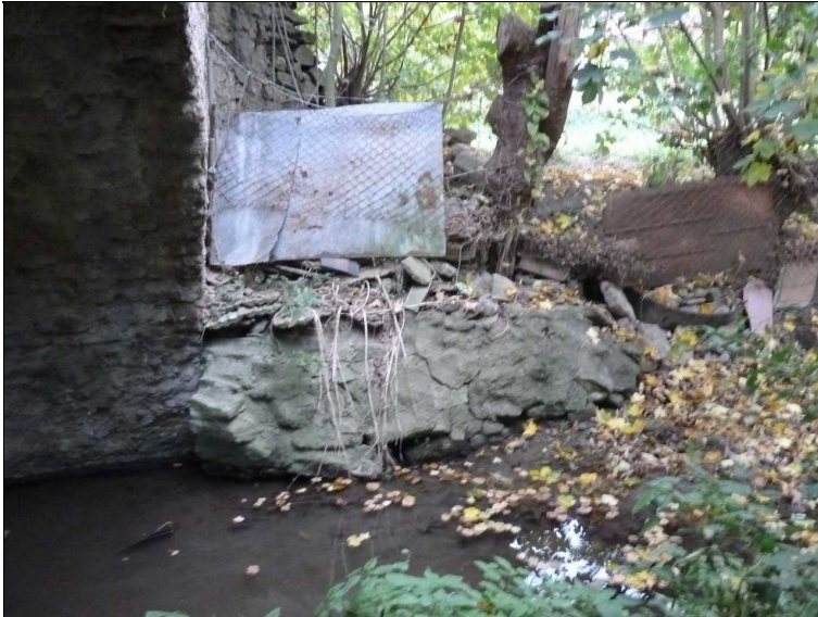
Podemleté křídlo vpravo u opěry O2