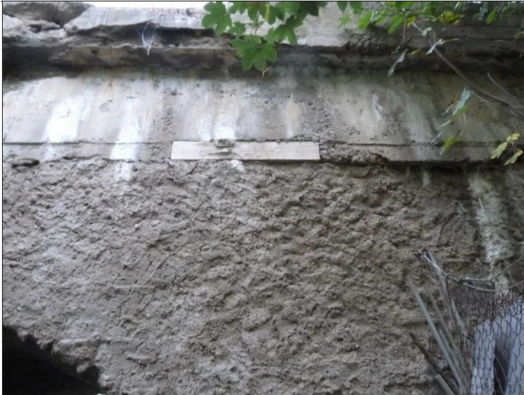
Detail čela vpravo nad opěrou O2.