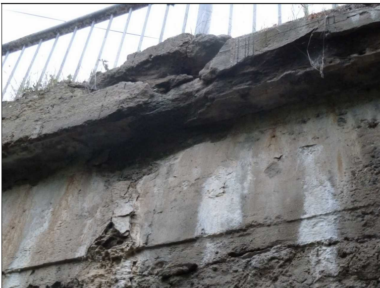
Detail rozpadlé římsy a protékajícího čela vpravo v ose mostu.