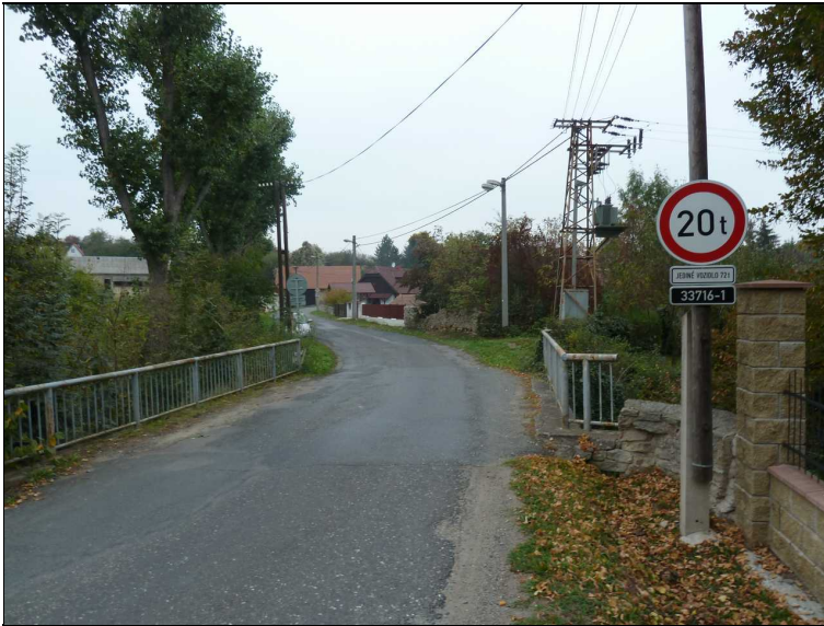
Pohled na most proti směru staničení