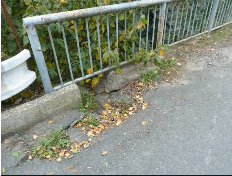
Podemletá římsa a vozovka u zaústění odvodnění vpravo za mostem.