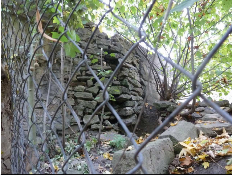
Rozpadlé zdivo pravého křídla opěry O2.