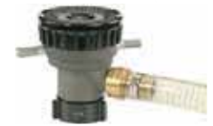
Style 888 Self-Educating Nozzle (750 GPM)

sales @protekfire.com.tw • www.protekfire.com.tw