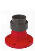
Style 190 Direct Mount Flange