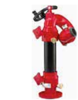
Style 656 shown with Style 622 monitor liftoff