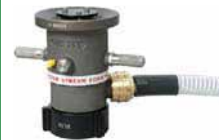
Style 887 Self-Educating Nozzle (500 GPM)