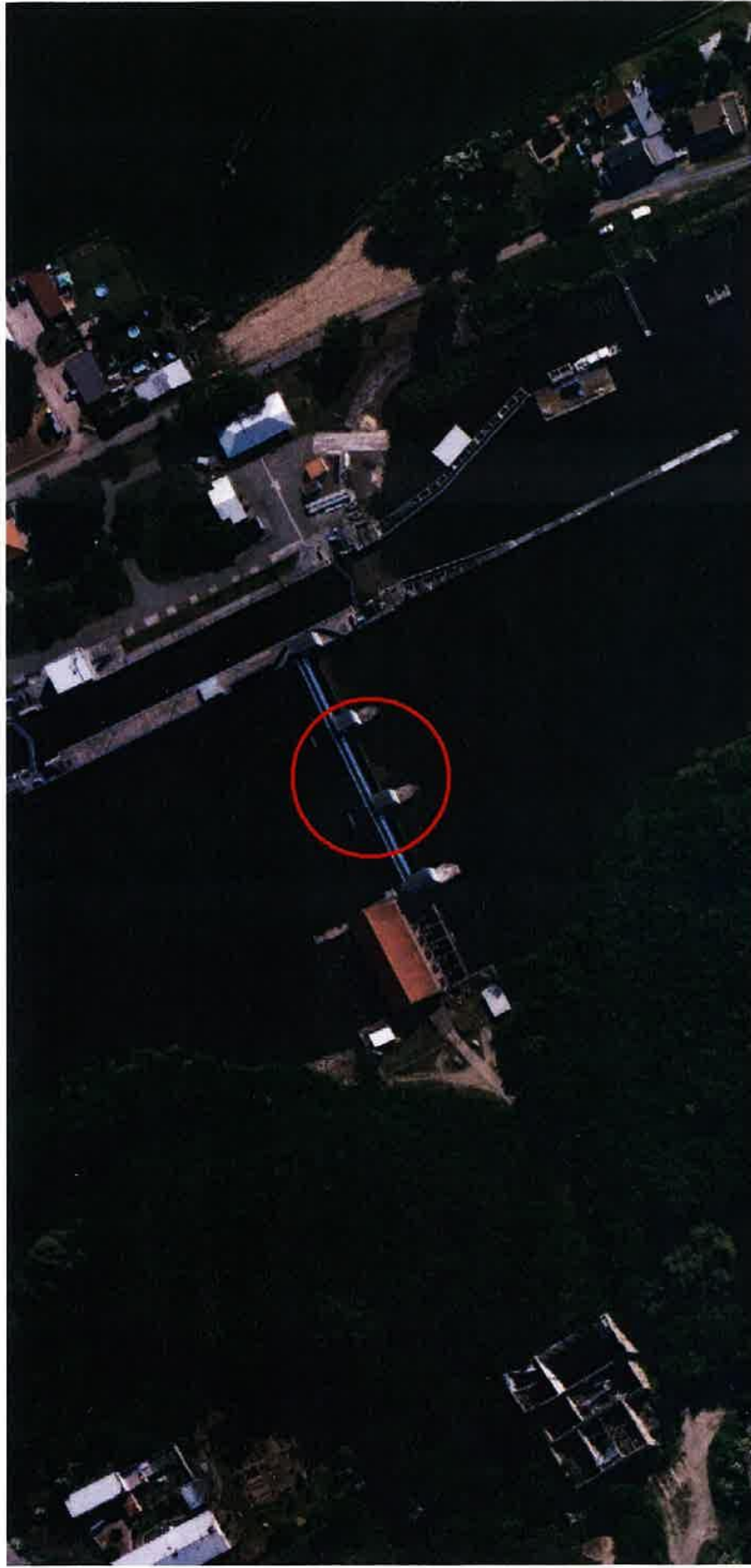
VD Klavary, oprava spodní stavby jezu, potápěčské práce