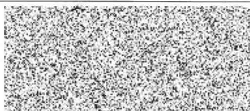
podpis a razítko