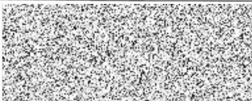
podpis a razítko