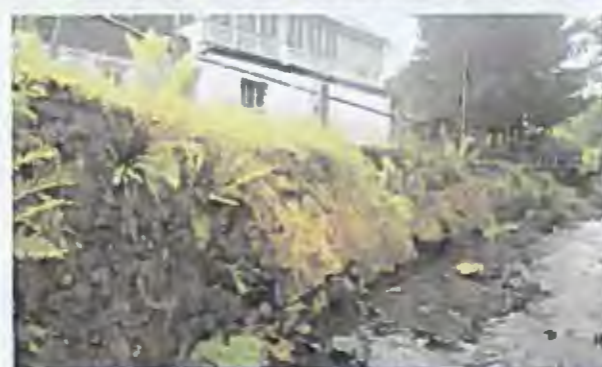
Silnice III/2628 Skalce u České Úpy, rekonstrukce opěrných zdí