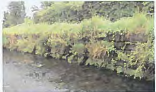
Sáňice III/2628 Skalce u České Lípy, rekonstrukce opěrných zdí