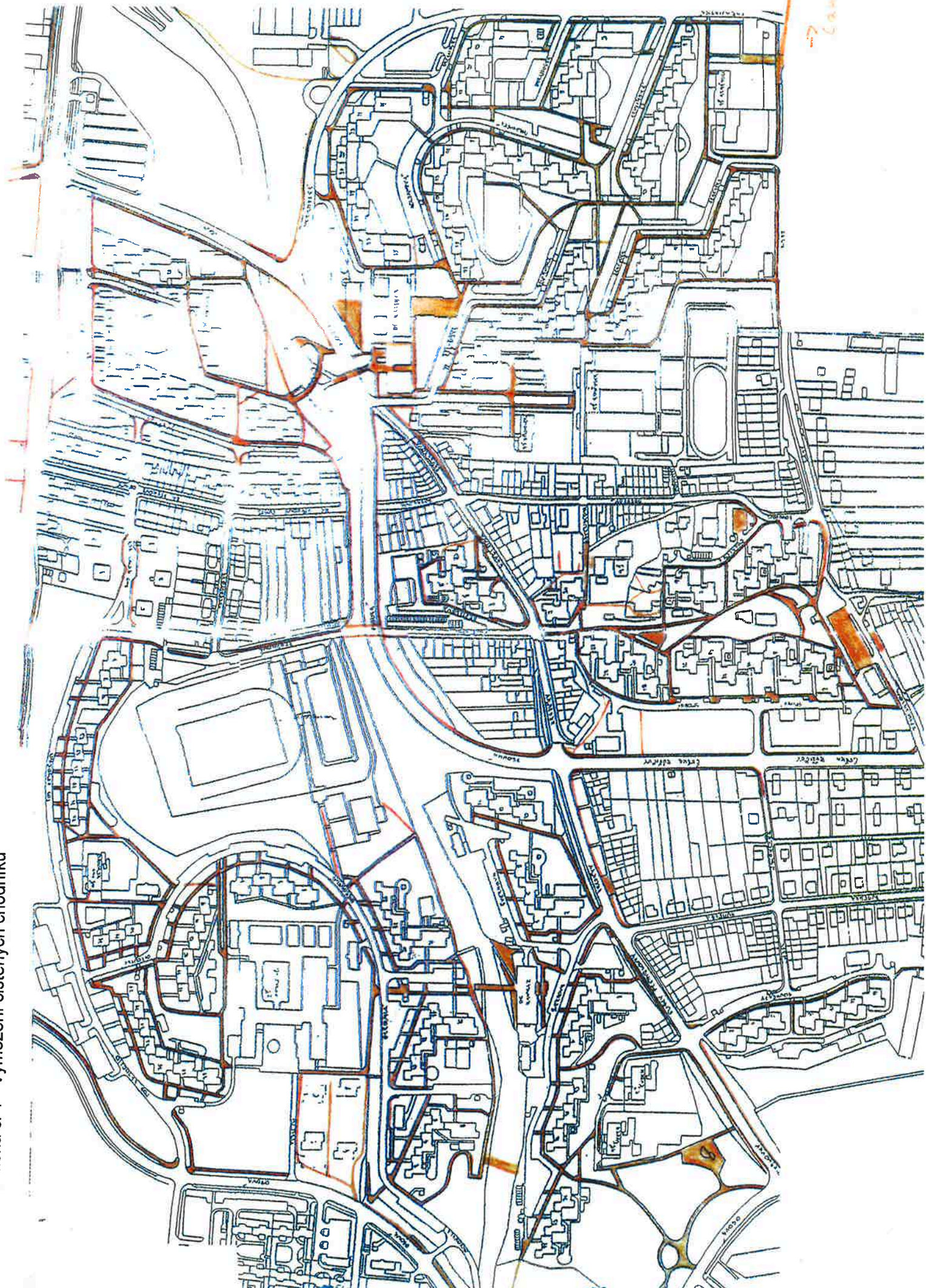
Priloha c. 1 - Vymezení čistých chodníků