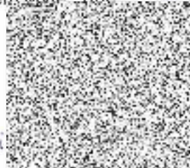
Zhotovitel : Miloš Straka, revizní technik