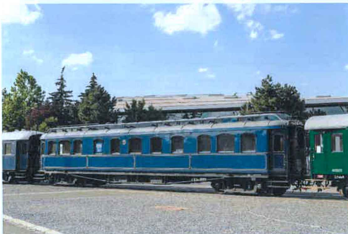
Inventární číslo 35399 – salónní vůz Aza 1-0086