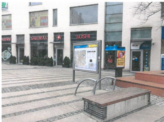
Ul. 5. května/a