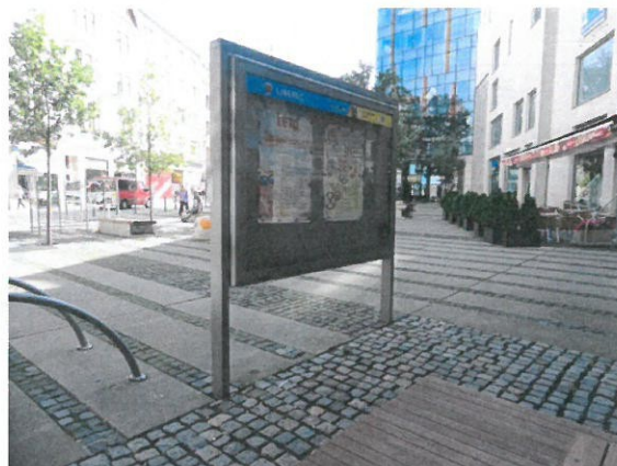
Ul. 5. května/b