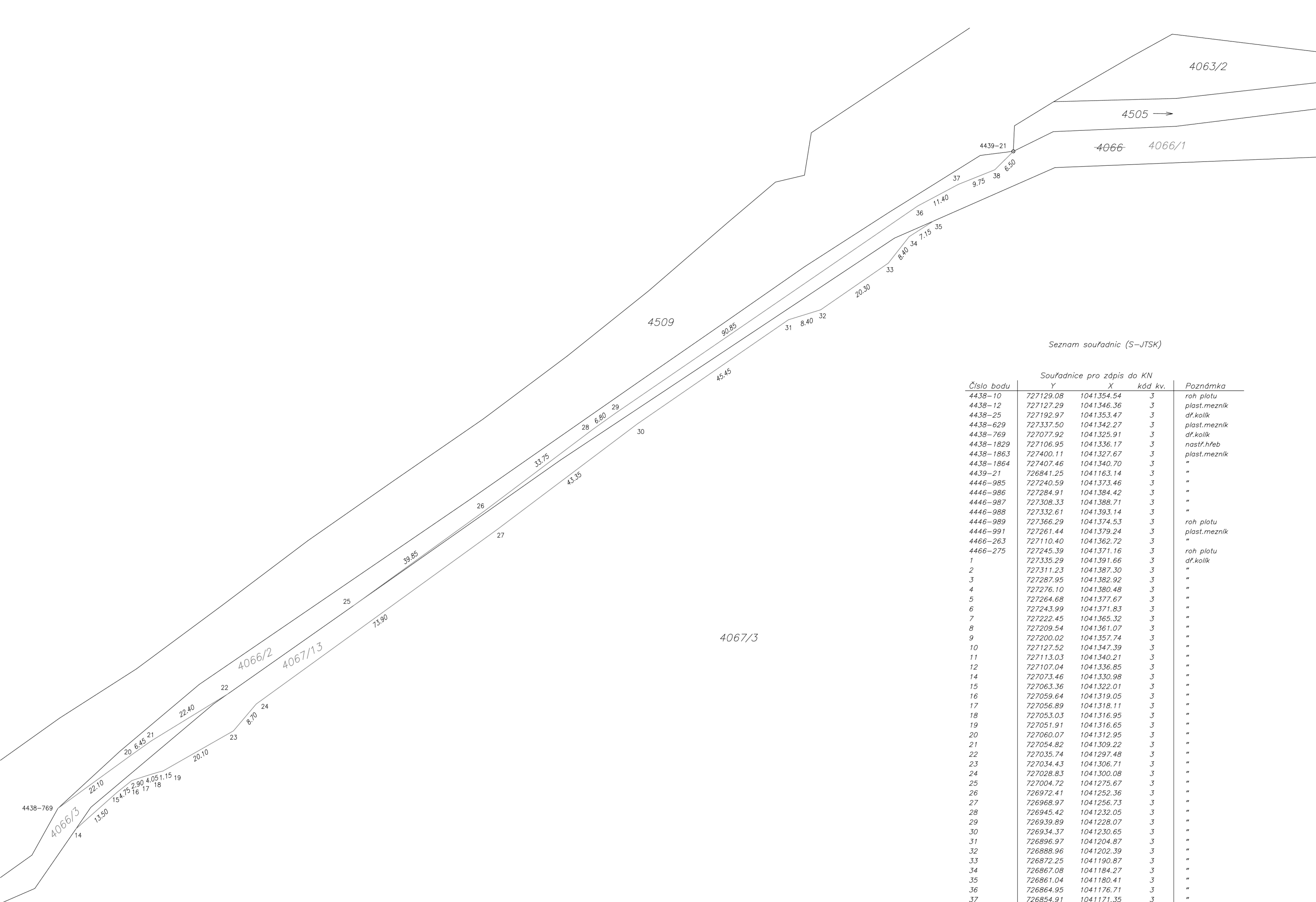
Seznam souřadnic (S-JTSK)