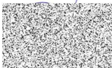
starosta města Vsetín

Ve Vsetíně dne 23.2.2021 Za příjemce: Divadlo v Lidovém domě, z.s.