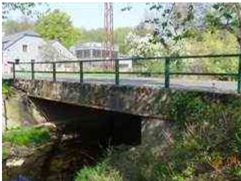
Pravá strana mostu