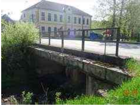
Levá strana mostu