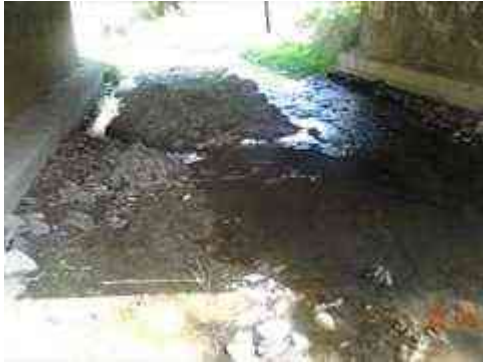
Pohled do mostního pole zprava