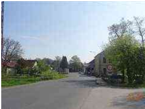
Pohled ve směru staničení