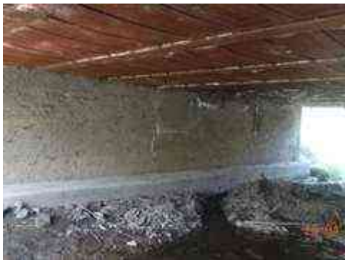
Pohled na opěru I