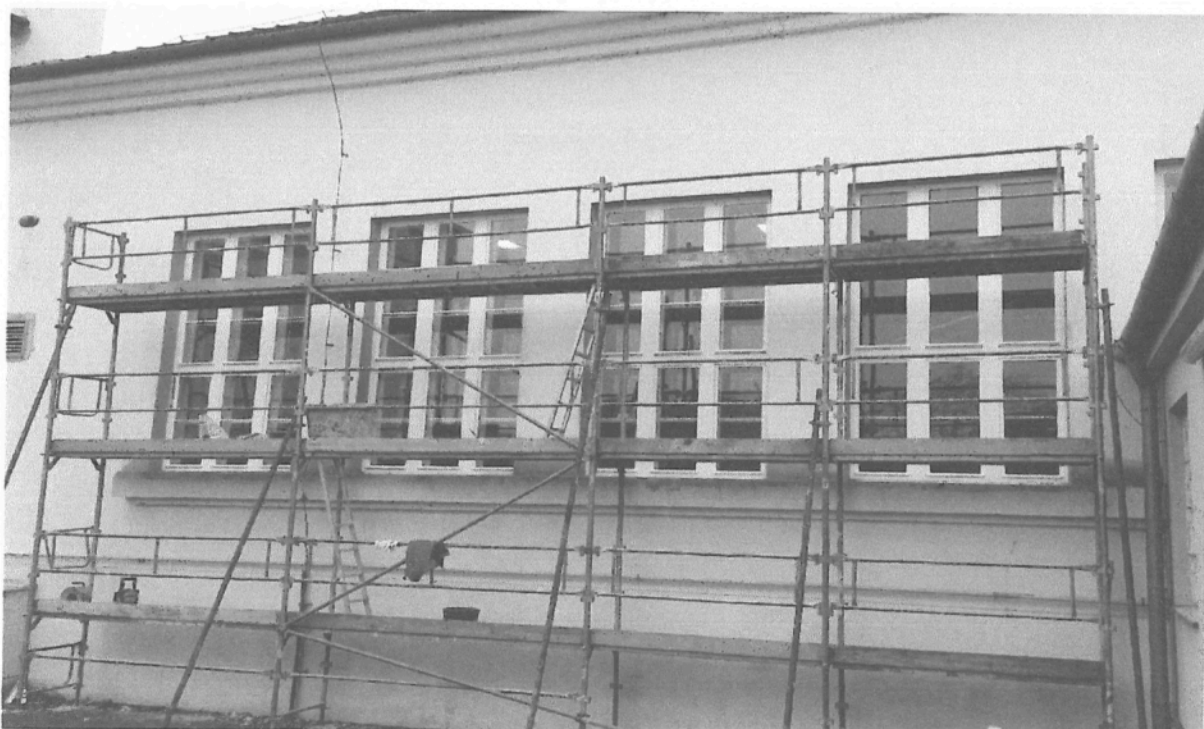
Venkovní podparapetní římsa