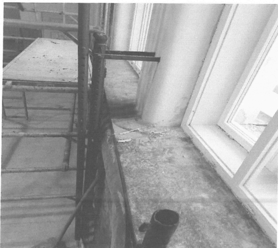
vnitřní betonový parapet