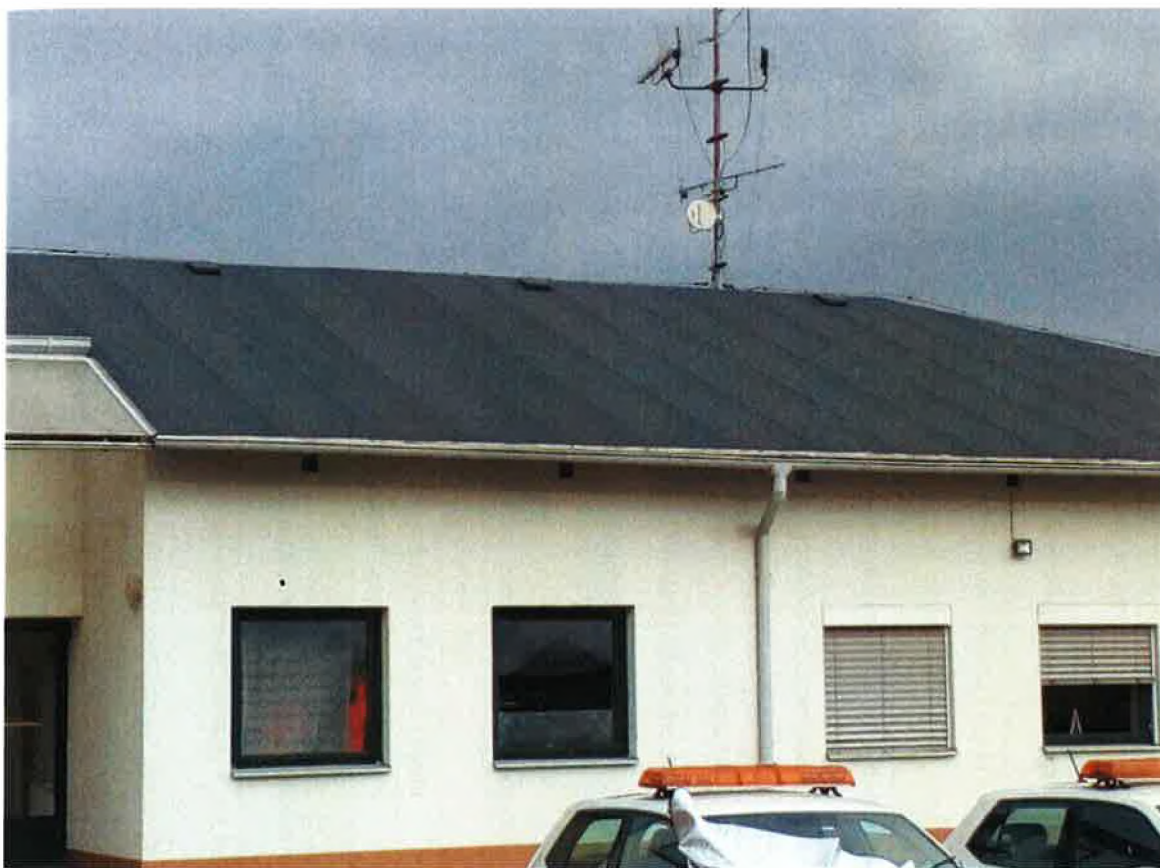
Požadovaná barva nové střešní krytiny je šedá.