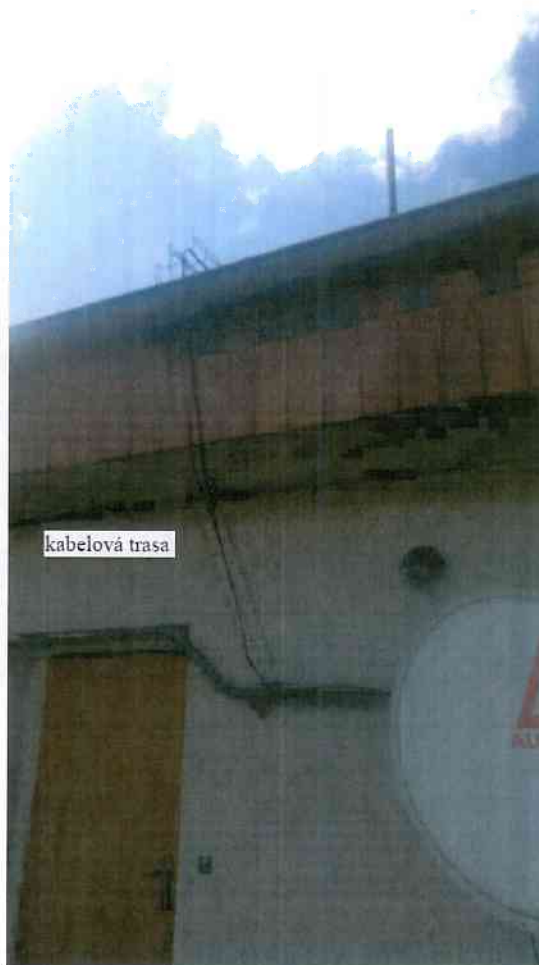
Obr. č.4, Kabelová trasa ve stávajících kabelových roštech