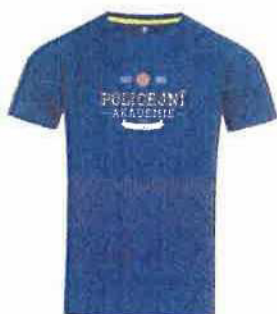
Funkční tričko 350 Kč