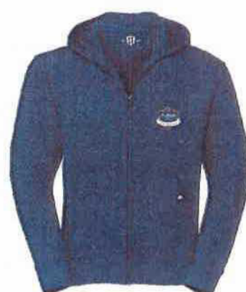
Mikina se zipem 680 Kč