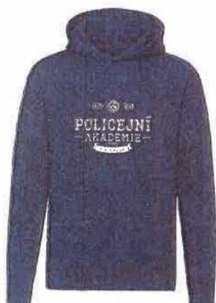
Mikina premium unisex 650 Kč