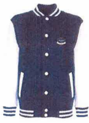
College mikina 750 Kč