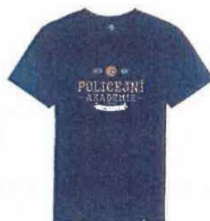
EKO tričko 350 Kč