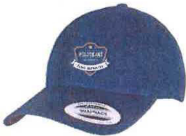
Kšiltovka classic 490 Kč