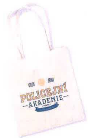
EKO taška přes rameno 260 Kč