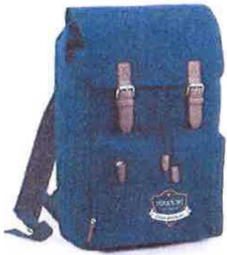
Batoh s potiskem 690 Kč