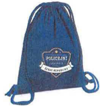
EKO Vak na záda 250 Kč