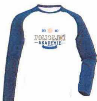
Baseballové tričko 450 Kč