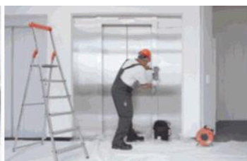
Servis 24 hodin