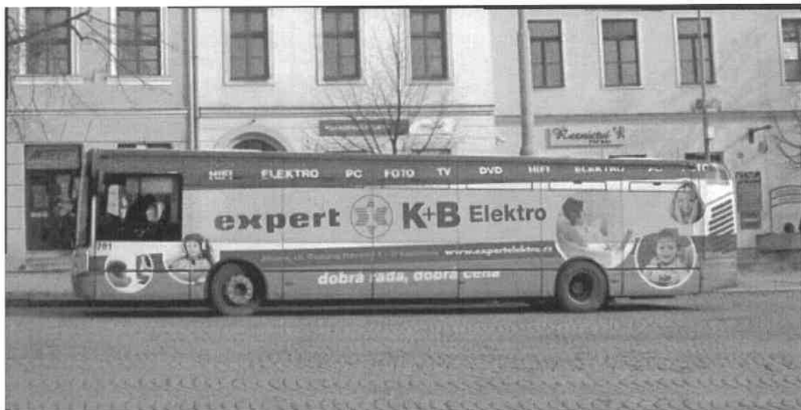
Autobusy a trolejbusy – zadní strana vozidla.