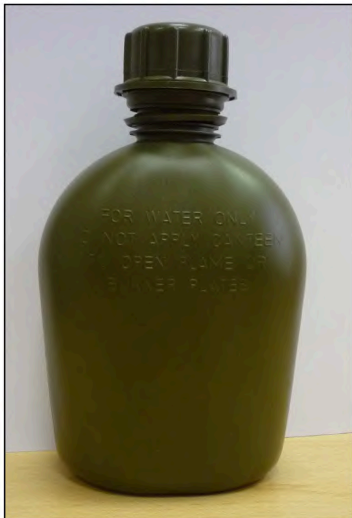
Vzorová fotografie č. 1