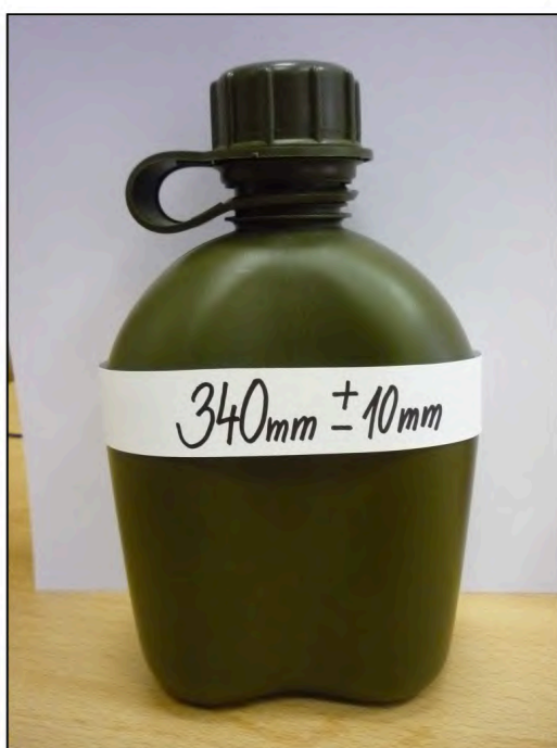
Vzorová fotografie č. 3