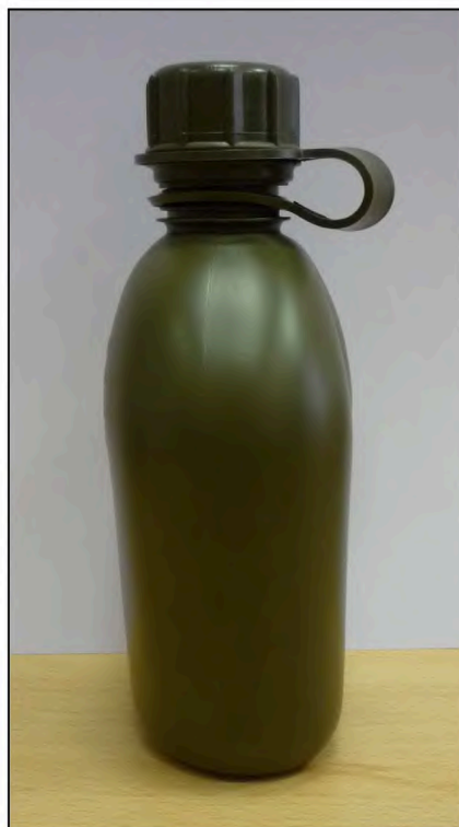
Vzorová fotografie č. 2