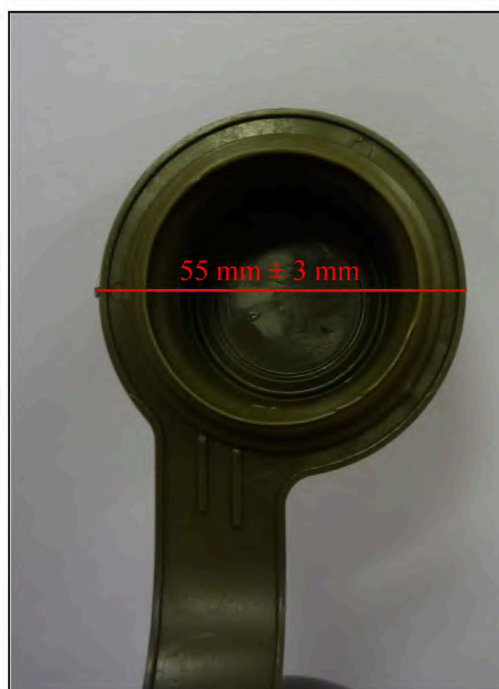
Vzorová fotografie č. 4