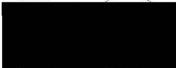
Městská část Praha-1 Ing. Oldřich Lomecký starosta