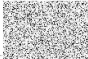
Středočeský kraj Libor Lesák radní pro oblast investic, majetku a veřejných zakázek