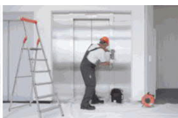
Servis 24 hodin