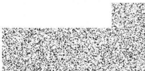
Úsek pojištění motorových vozidel Kooperativa pojišťovna, a.s., Vienna Insurance Group