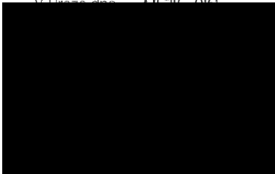
Národní agentura pro komunikační a informační technologie, s. p.