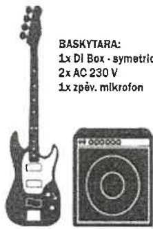
MON cesta 1

1x DI Box - symetrický jack 2x AC 230 V 1x zpěv. mikrofon