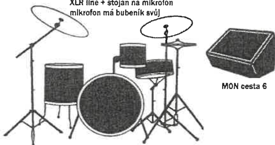
MON cesta 6

1x klck, 1x snare, 1x hl-hat, 2x tom, 1x floor tom 2x overhead XLR line + stojan na mikrofon mlkrofon má bubeník svůj