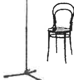
MON cesta 3