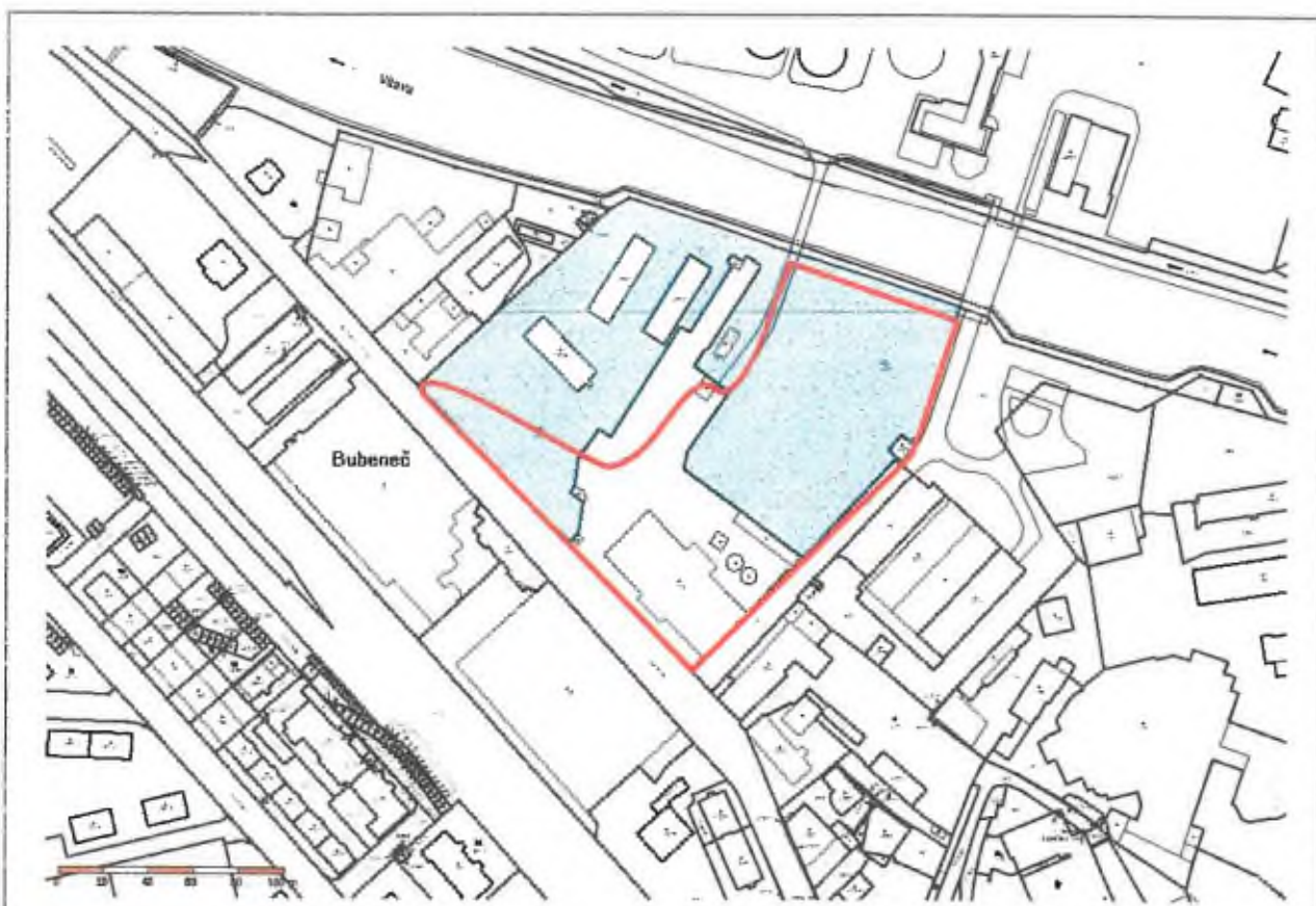
Č. parc. 1719, výřez z katastrální mapy ( http://nahlizenidokn.cuzk.cz/ ; 12/2014).