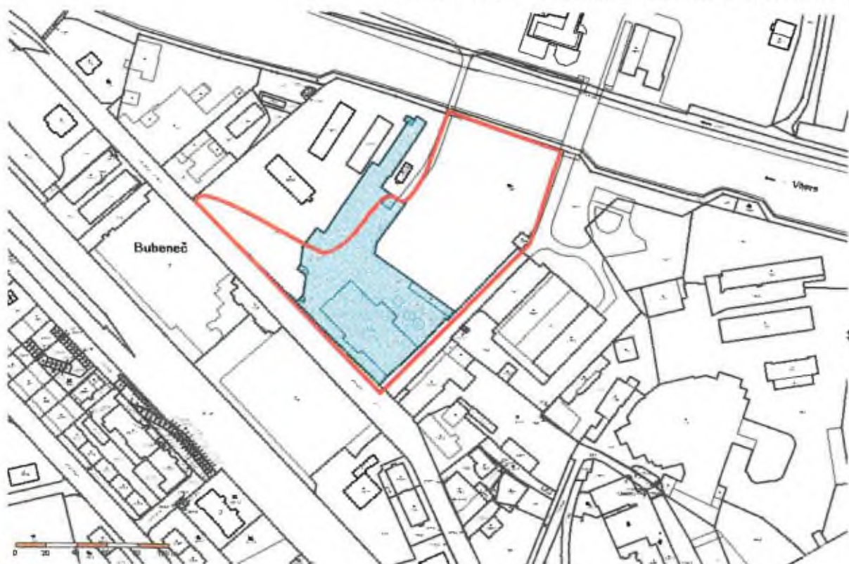
Č. parc. 1720/1, výřez z katastrální mapy ( http://nahlizenidokn.cuzk.cz/ ; 12/2014).