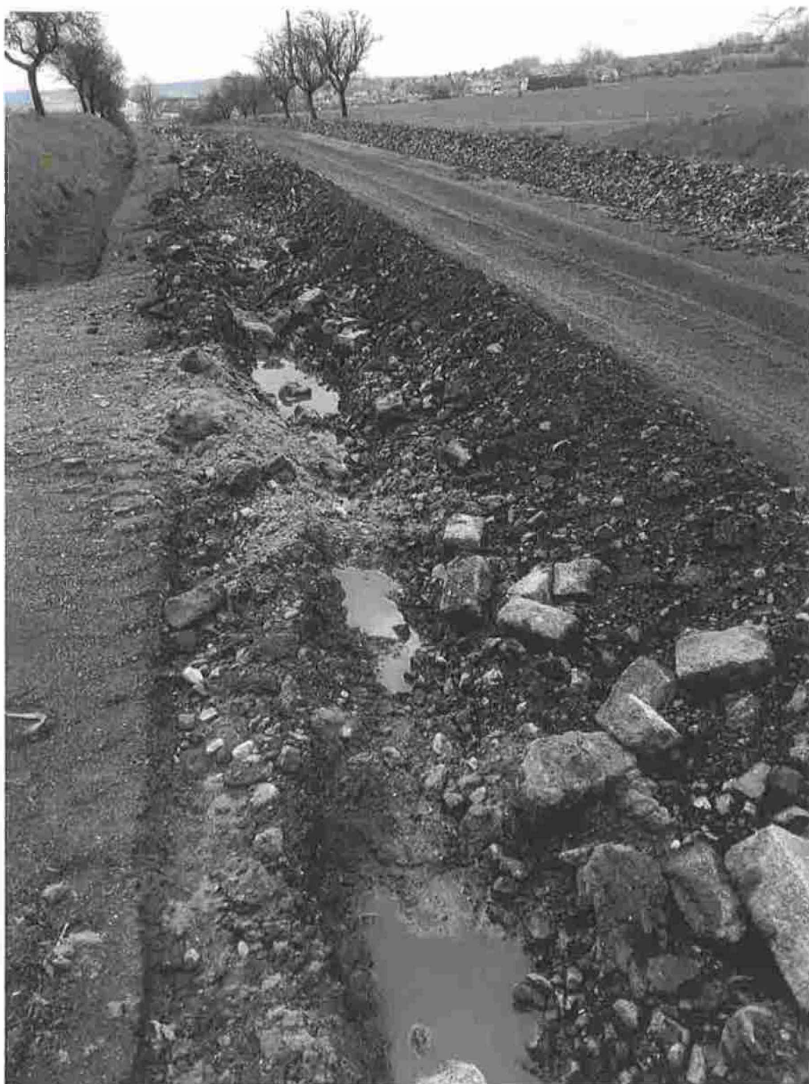
Obrázek 2 – Vybourání kamenné linky