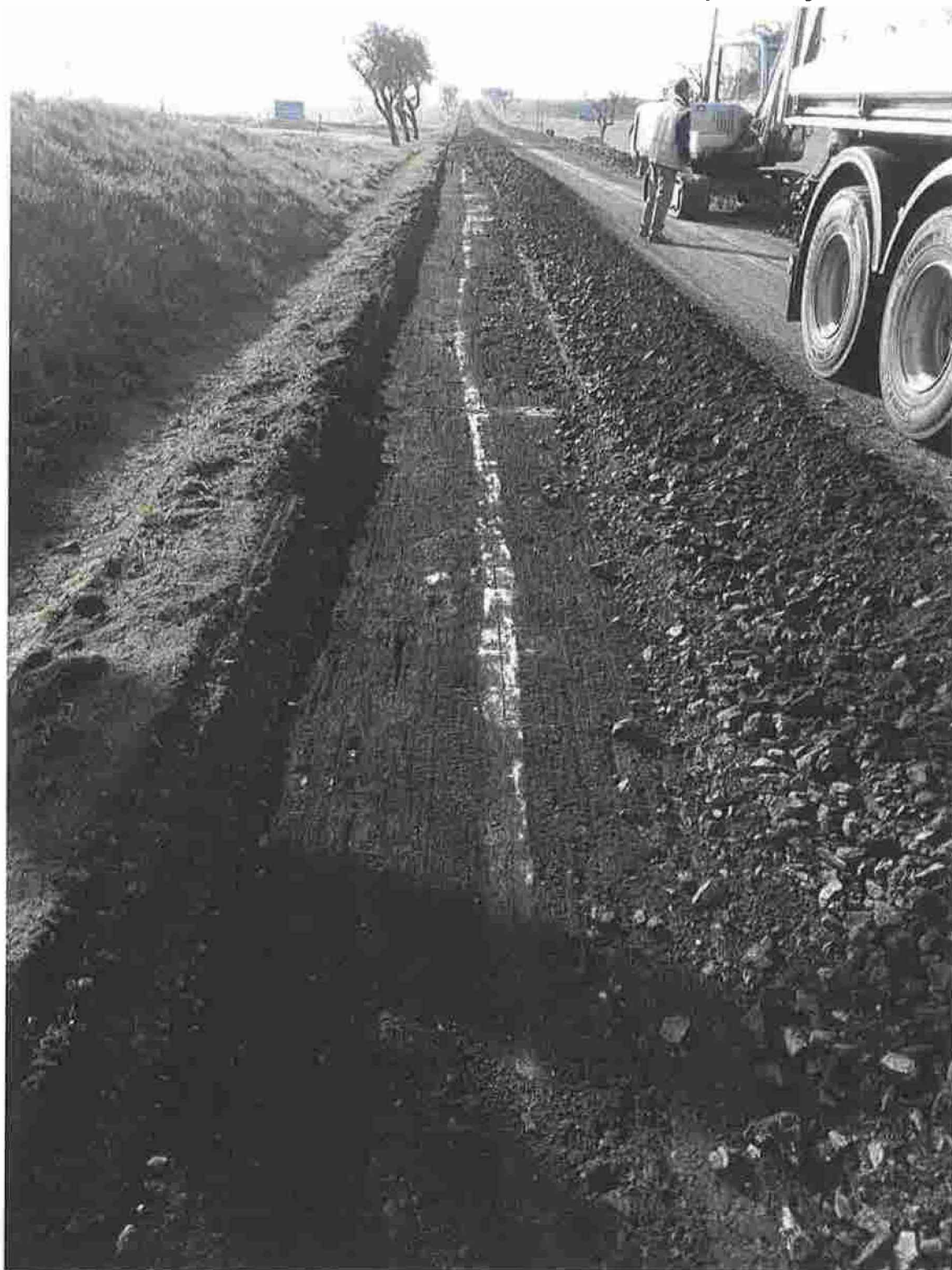
Obrázek 1 – Kamenná linka po odfrézování asfaltových vrstev