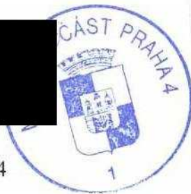
Irena Michalcová starostka městské části Praha 4