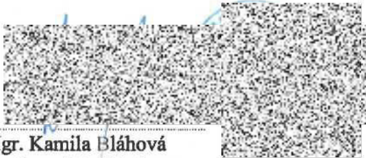
Mgr. Kamila Bláhová starostka města Litvínova