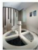
34 VOLAREZA Bedřichov Kneippův chodník