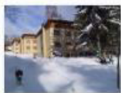
3 VOLAREZA Bedřichov - depandance zima