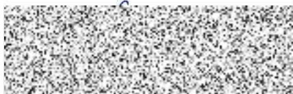
Město Vsetín vedoucí Odboru správy majetku, investic a strategického rozvoje