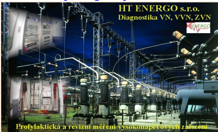
Profylaktická a revizní měření vysokonapěťových zařízení