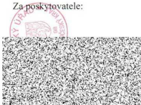
vedoucí Odboru školství Krajského úřadu Středočeského kraje