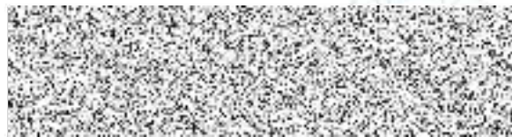
Ing. Jiří Snížek Náměstek hejtmanky pro oblast regionálního rozvoje a územního plánování.