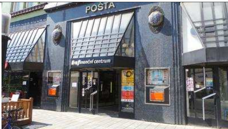
Obložení pošty z labradoritu