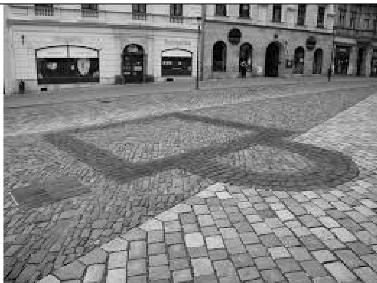
Dolní náměstí kaple sv. Markéty