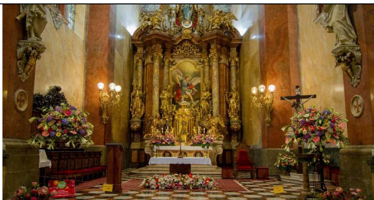
Kostel sv. Michala – dlažba u oltáře