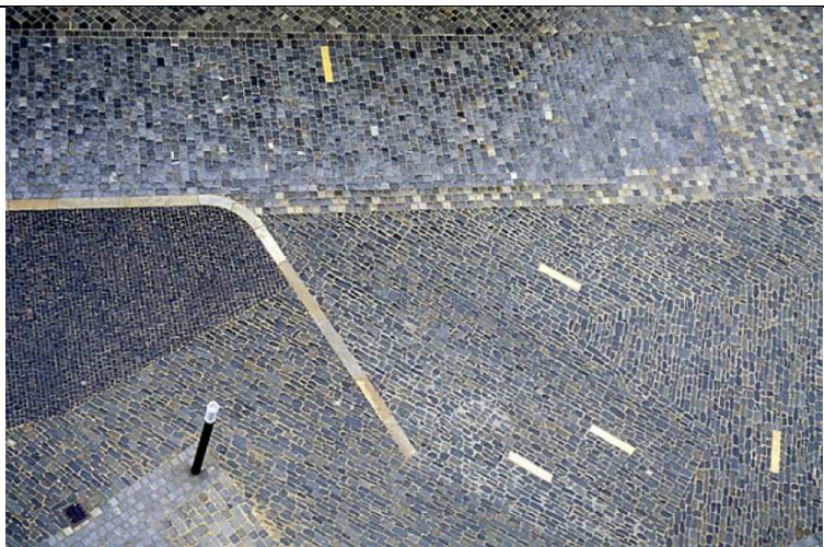
Dlažby Horní náměstí