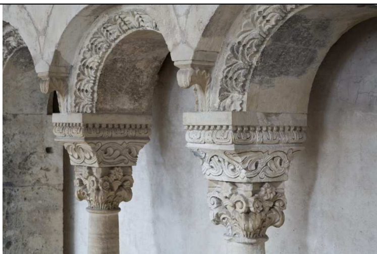
Zdrův palác, sdružená okna ze služínského vápnitého pískovce /spongilitu/