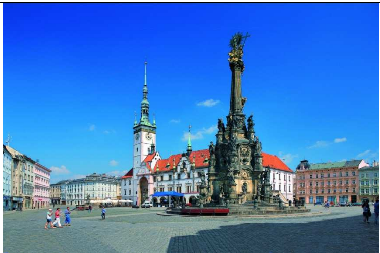
Sloup Nejsvětější Trojice