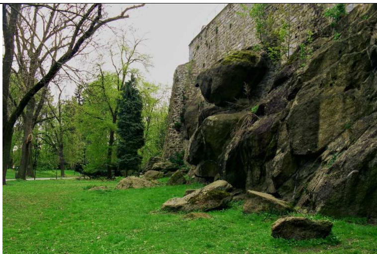
Místo vrtu OL-1