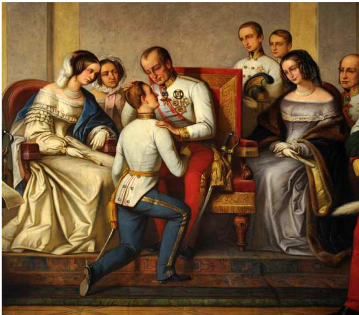
(výřez obrazu malíře Adolfa Rabenalta z roku 1876, umístěném původně na olomoucké radnici)