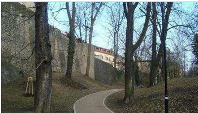
Lomový kámen hradeb pod Konviktem