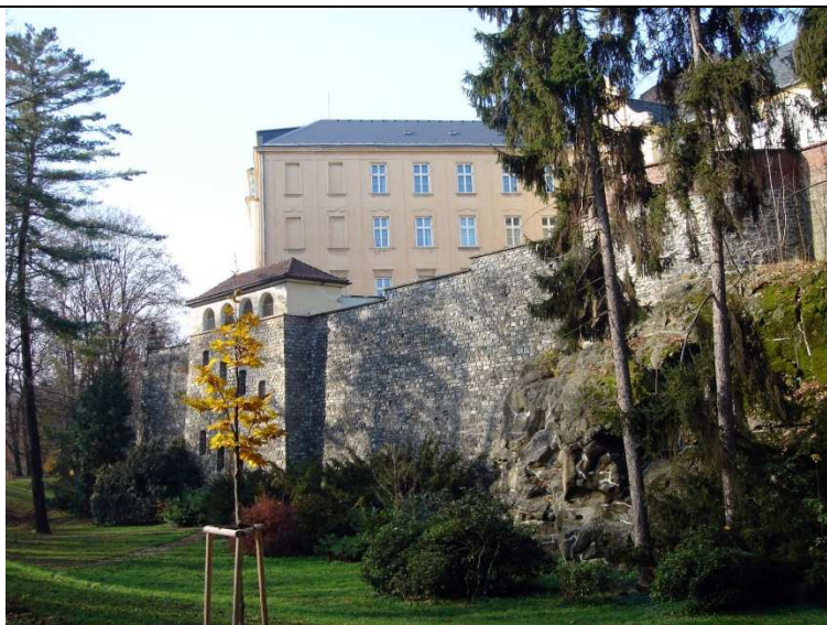
Kvádříkové zdivo hradeb