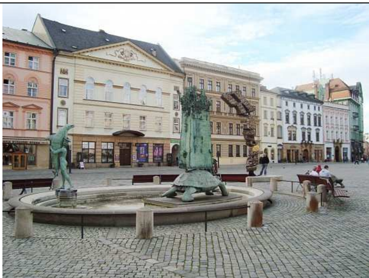
Místo historického vrtu