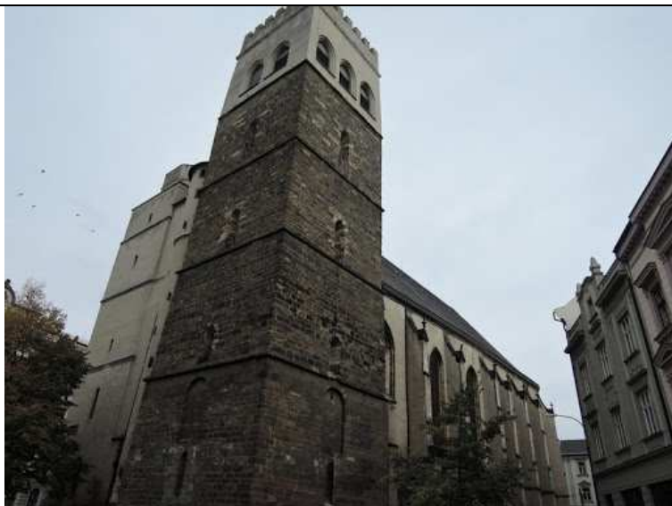
Kostel sv. Mořice, věž + sokl