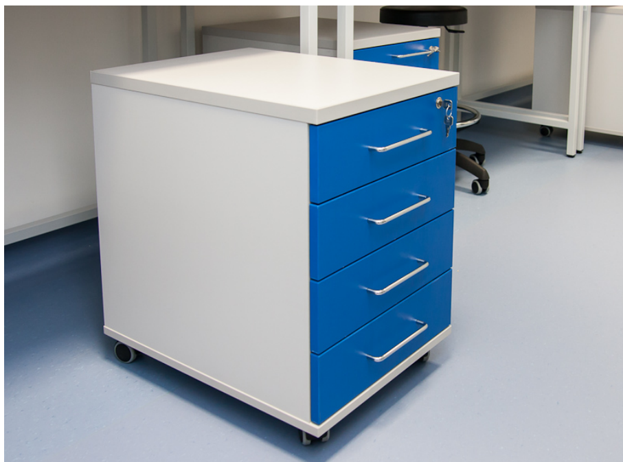
Obrázek 3 - Referenční kontejner (na fotografii menší velikost se 4 zásuvkami)