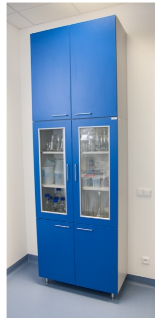
Obrázek 5 - Referenční nástavec na prosklené laboratorní skříni