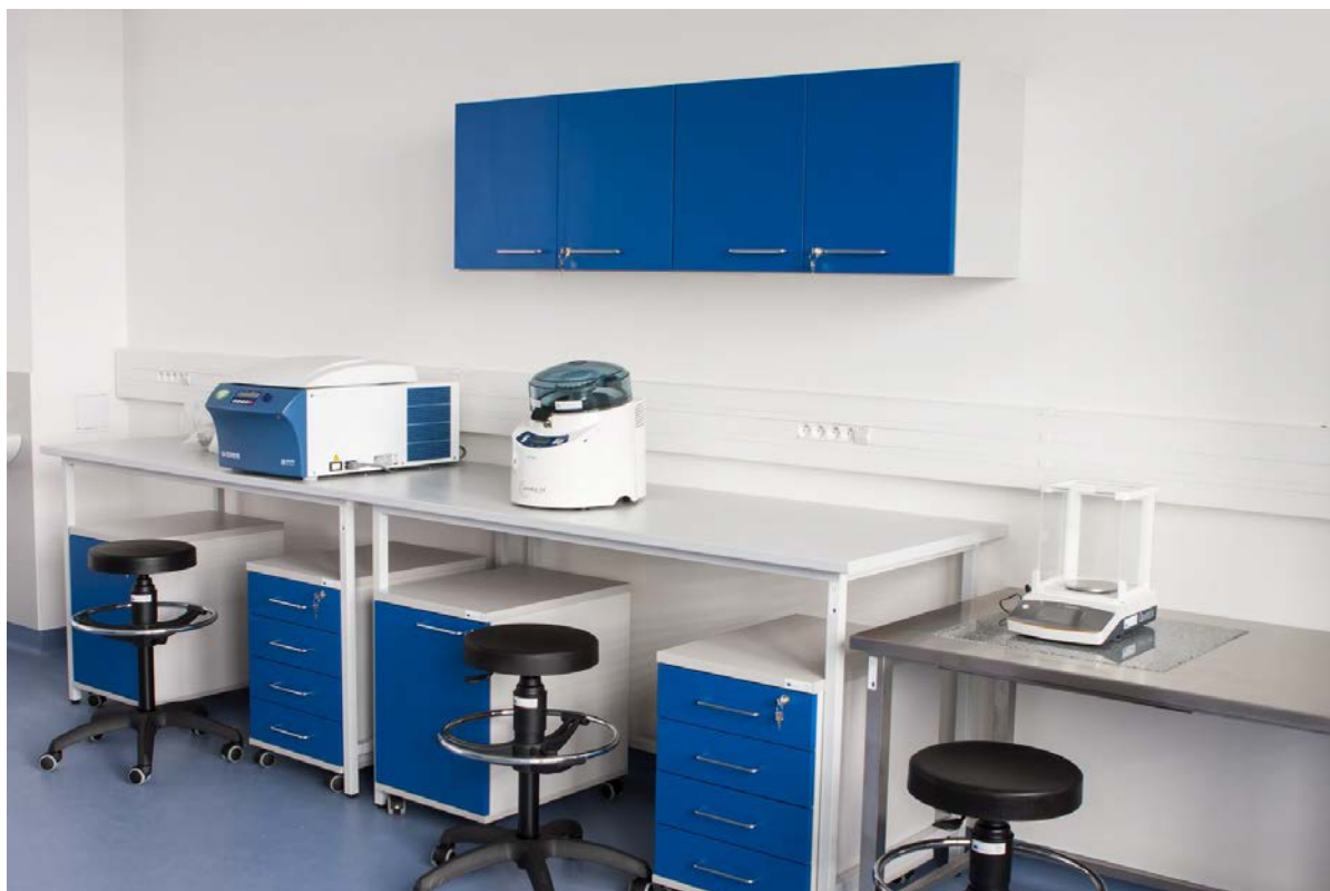
Obrázek 1 - vzhled stávajících laboratoří