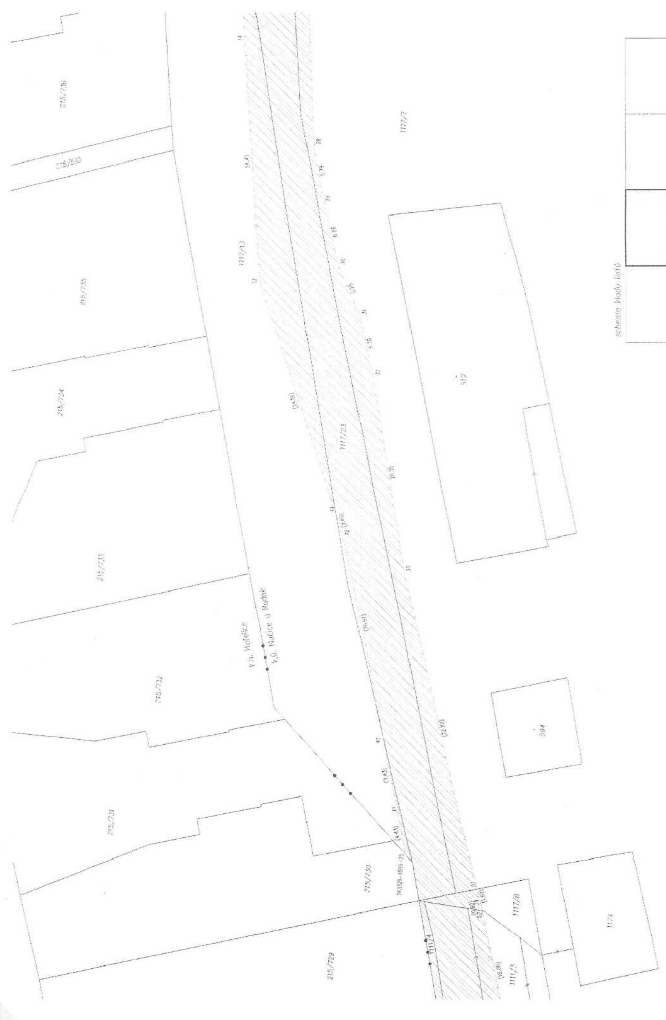
schéma kladu listů