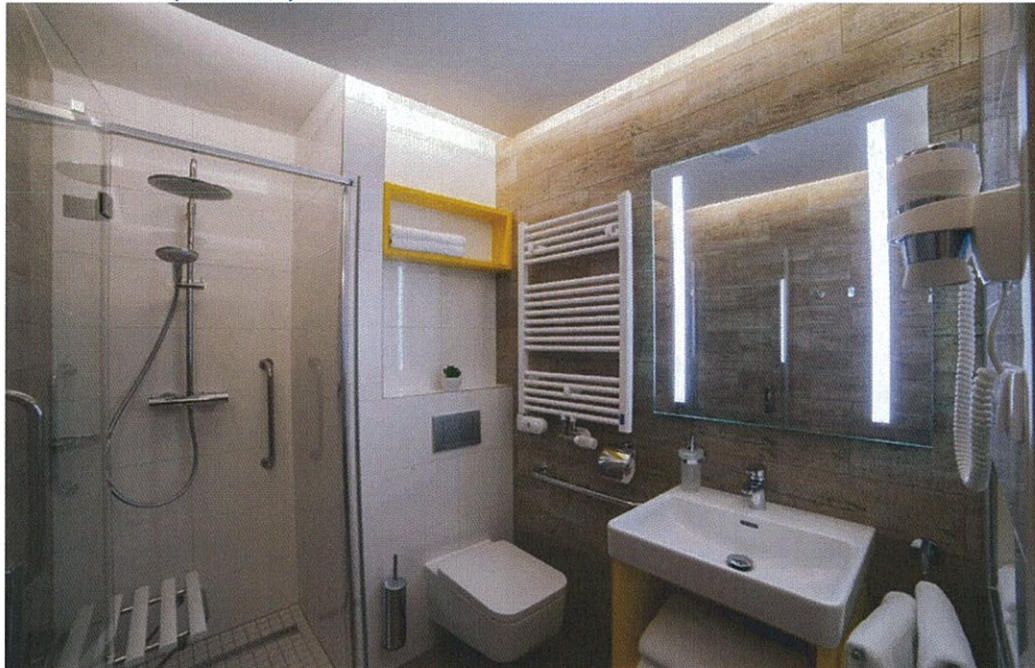
Hotel Terra*** Superior – koupelna