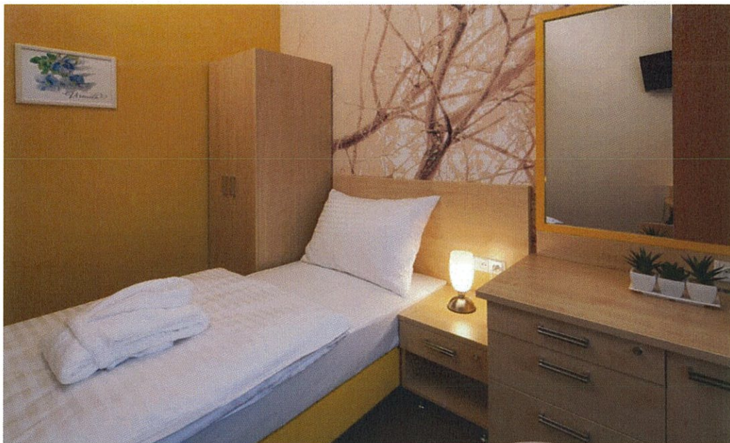
Hotel Terra*** Superior - dvouúžkový pokoj Iris