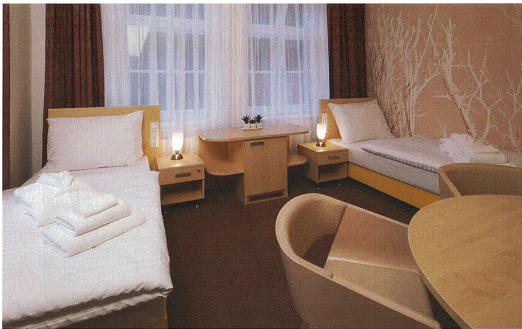
Hotel Terra*** Superior – apartmá Lotus