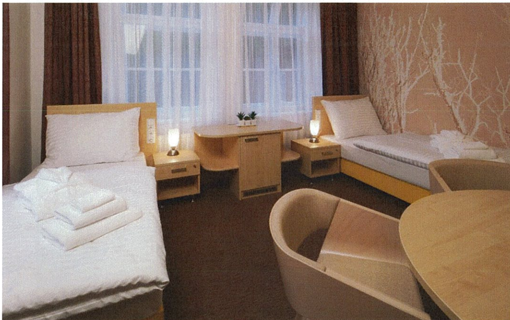
Hotel Terra*** Superior – apartmá Lotus