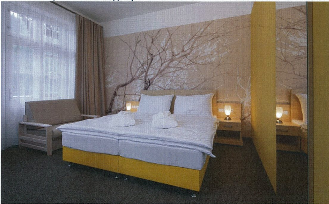
Hotel Terra*** Superior – dvoulůžkový pokoj – oddělené postele Bellis

Státní léčebné lázně Janské Lázně, státní podnik