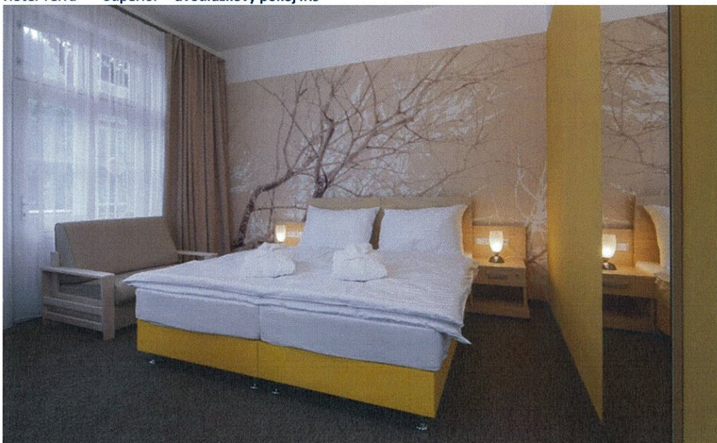
Hotel Terra*** Superior – dvouúžkový pokoj – oddělené postele Bellis

Státní léčebné lázně Janské Lázně, státní podnik