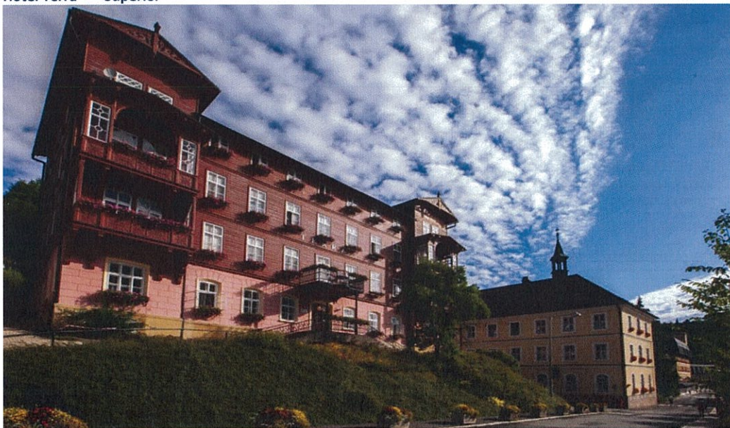
Hotel Terra*** Superior – jednolůžkový pokoj Veronica

Státní léčebné lázně Janské Lázně, státní podnik