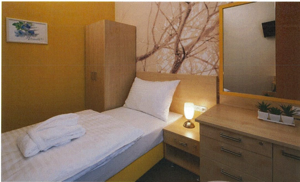
Hotel Terra*** Superior – dvoulůžkový pokoj Iris