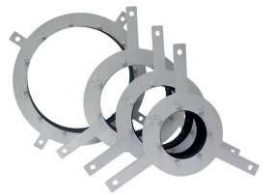
Nedělená těsnící vložka PS Standard – biogas