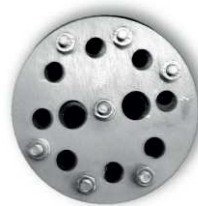
Nedělená těsnící vložka PS Standard – vícenásobná