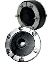
Dělená těsnící vložka PS Standard – univerzální