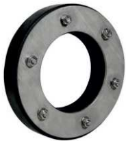
Nedělená těsnící vložka PS Standard