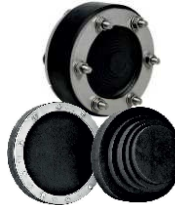
Nedělená těsnící vložka PS Standard – univerzální