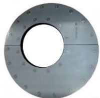
Dělená těsnící vložka PS Standard – excentrická