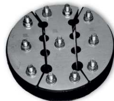
Dělená těsnící vložka PS Standard – vícenásobná