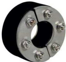
Dělená těsnící vložka PS Standard