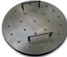
Nedělená těsnící vložka PS Standard – záslepka s madly