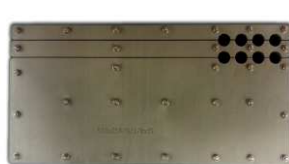
Dělená těsnící vložka PS Standard – čtvercový/obdélníkový otvor