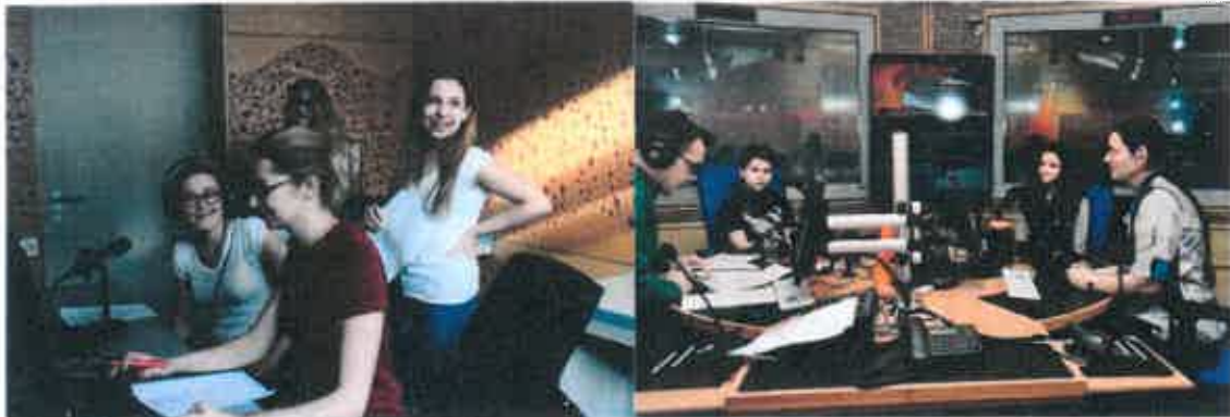
Workshopy ve studiu Českého rozhlasu

Aby byly výstupy žáků co nejlepší, mohou se v rámci projektu zúčastnit celé řady workshopů. Úvodní workshop Jak natočit pamětníka absolvují všechny týmy pod vedením regionálního koordinátora. Mediální workshopy vedou profesionální filmaři či rozhlasoví redaktori. Audio workshopy mohou proběhnout ve škole nebo také ve studiu Českého rozhlasu, kam zamíří ty týmy, které chtějí natočené vyprávění pamětníka zpracovat do rozhlasového dokumentu. Žáci si dopředu připraví scénář a ve studiu Českého rozhlasu svou nahrávku pamětníka za pomoci redaktora sestřihají do ucelené rozhlasové reportáže. Učí se práci rozhlasového redaktora a moderátora. Pracují tu také s profesionálním zařízením pro střih. Ty týmy, které se rozhodnou natáčet pamětníky na video záznam, mají možnost absolvovat video workshop. Nově nabízíme týmům také workshop narativních dovedností nazvaný Jak vyprávět příběh . Učí žáky, jak z velkého množství sesbíraného materiálu vybrat do výsledné reportáže to důležité.