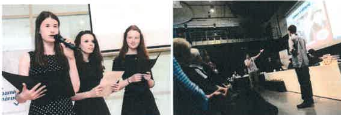
Slavnostní prezentace pamětnických příběhů