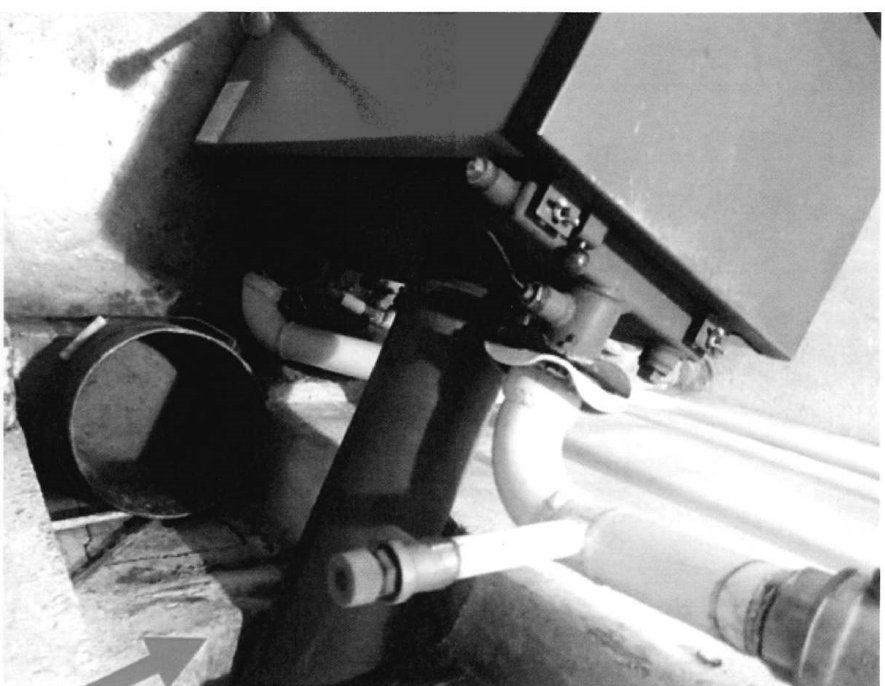
Vodná 64, kotel OPOP H418V Napojení kotle na topný vodní okruh do spalinové vedení do komína