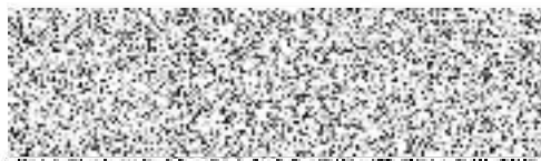
Materáská škola, Nové školy, příspěvková organizace