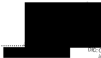
jednatel TST s.r.o.

Technické služby TÁBOR, s.r.o. Kpt. Jaroše 2418 390 03 Tábor 3 DIČ: CZ62502565 jednatel