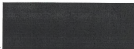
Římskokatolická farnost Prachatice vlastník objektu