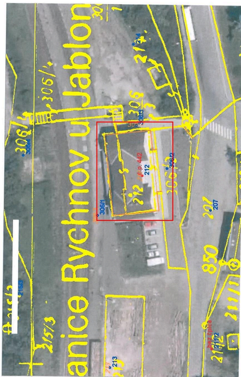
Příloha č.1a) Kopie katastrální mapy