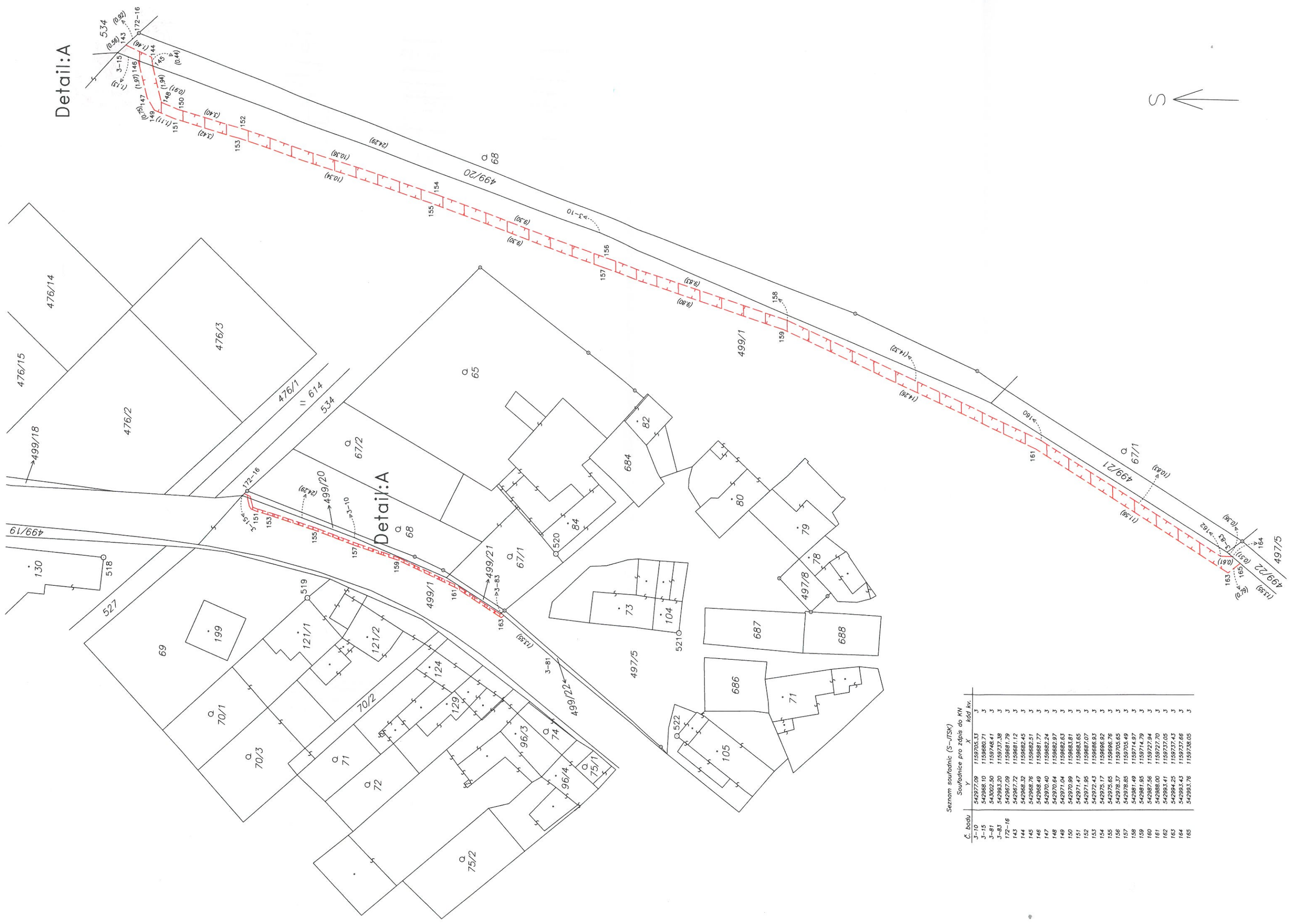
Seznam souřadnic (S-JTSK)