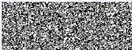
Pavliš a Hartmann, spol. s r.o.