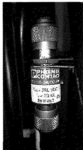
Ilustrační obrázek bleskojistky