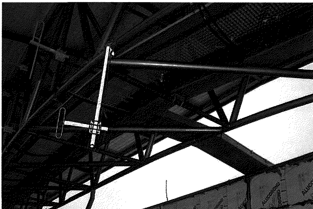
Ilustrační obrázek umístění antény na příhradovém střešním nosníku