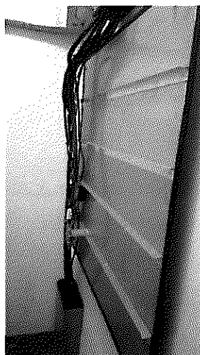
Ilustrační obrázek bleskojistkového pole

Každý svod bude osazen zemnicí sadou, při prvním vstupu kabelové trasy do budovy bude každý kabel připojen přes bleskojistkové pole a osazen bleskojistkou Phoenix-Contact CN-UB-280DC-BB (z důvodu použitého standardu budovy IBC a stávajícího provedení ostatních svodů). Bleskojistkové pole a bleskojistka viz následující obrázky, bleskojistkové pole je k dispozici.