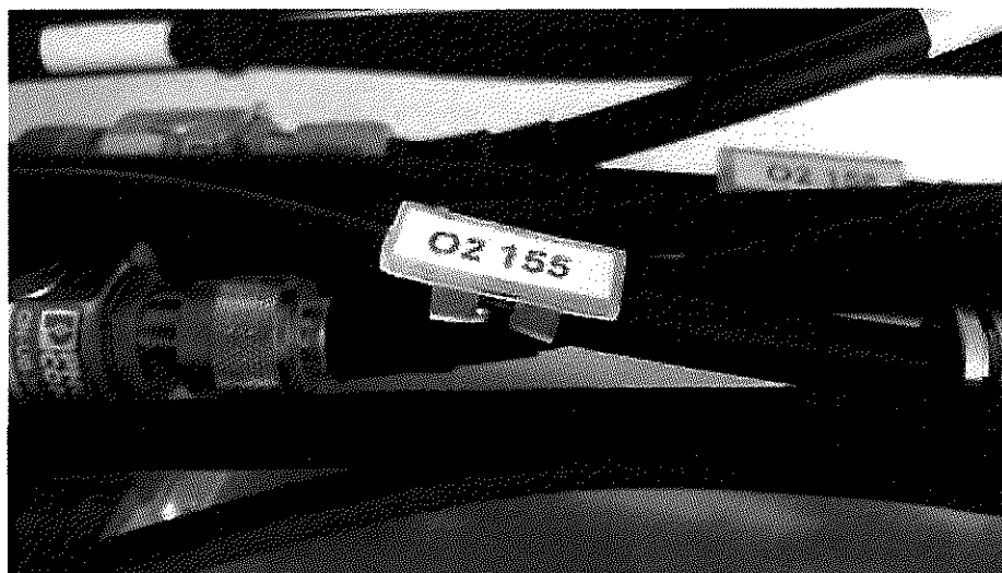
Ilustrační obrázek záklopného štítku na kabelu

Koaxiální kabely budou popsány u antény, bleskojistkového pole a na konci kabelu pomocí záklopného štítku (odolné proti povětrnostním podmínkám) viz obrázek.