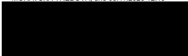
MONETA Money Bank, a.s.